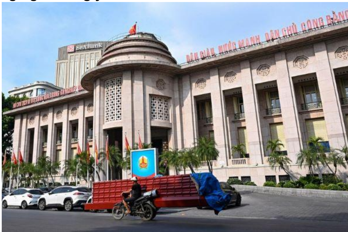
Trụ sở Ngân hàng Nhà nước Việt Nam ở Hà Nội.