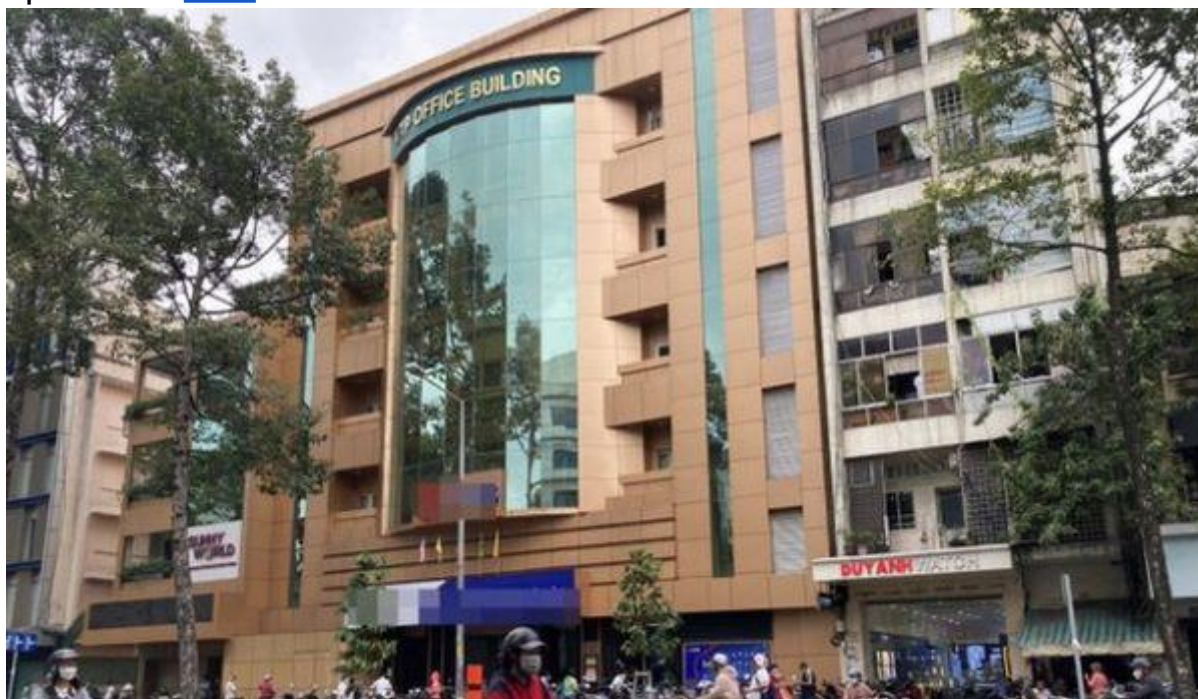
Trụ sở của Vạn Thịnh Phát ở TPHCM. vov.vn

Cựu cục trưởng của Ngân hàng Nhà nước bị cơ quan điều tra cáo buộc nhận hồi lộ số tiền đặc biệt lớn lên đến 5,2 triệu USD trong vụ án xảy ra tại Tập đoàn Vạn Thịnh Phát.