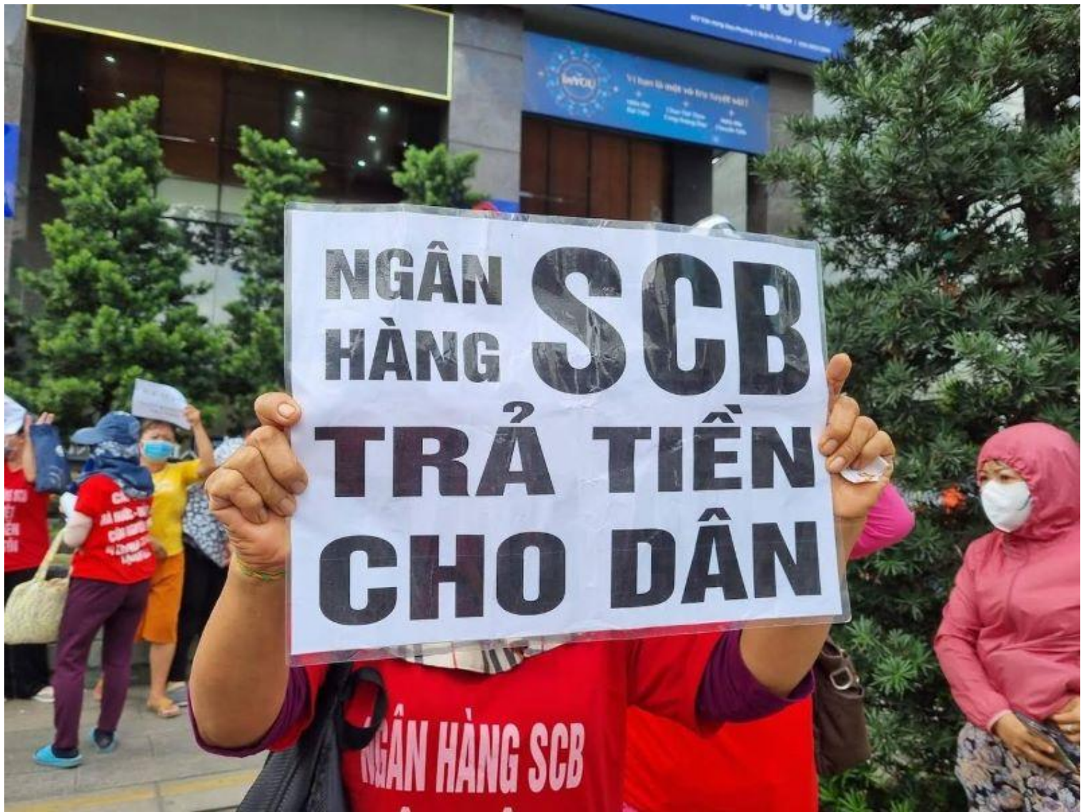
Ảnh: Người dân xuống đường biểu tình, đòi tiền SBC. Photo Courtesy