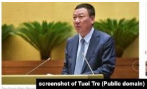
screenshot of Tuoi Tre

Ông Đoàn Hồng Phong, Tổng Thanh tra Chính phủ Việt Nam, nói tại Quốc hội, 21/11/2023.