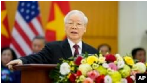
Tổng bí thư Nguyễn Phú Trọng.

Chủ trì cuộc họp tại của Thường trực Ban Chỉ đạo Trung ương về phòng, chống tham nhũng, tiêu cực hôm 22/11, Tổng Bí thư Đảng Cộng sản Việt Nam Nguyễn Phú Trọng ca ngợi công tác phòng chống tham nhũng đang ngày càng làm tốt, nhưng yêu cầu các cơ quan phải “hợp đồng tác chiến” và chớ “làm ví dụ, làm để cho có”, theo trang tin chính thức của chính phủ Việt Nam.